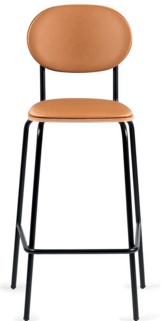
TABURETE / TAMBORET TABOURET / BARSTOOL / BARHOCKER