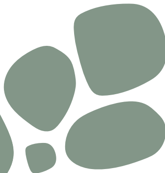
APILABLE / EMPILABLE / CHAISE USAGE / STACKABLE CHAIR / STAPELBAR.